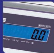
Blue backlight LCD