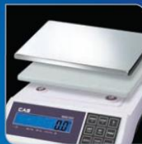
Double tray type (Plastic and stainless steel)